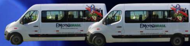
02 Vans 16 l