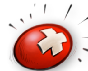
PARCEIRO NARIZ VERMELHO