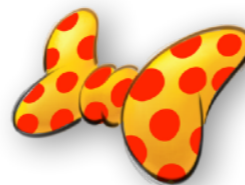
PARCEIRO GRAVATA BORBOLETA