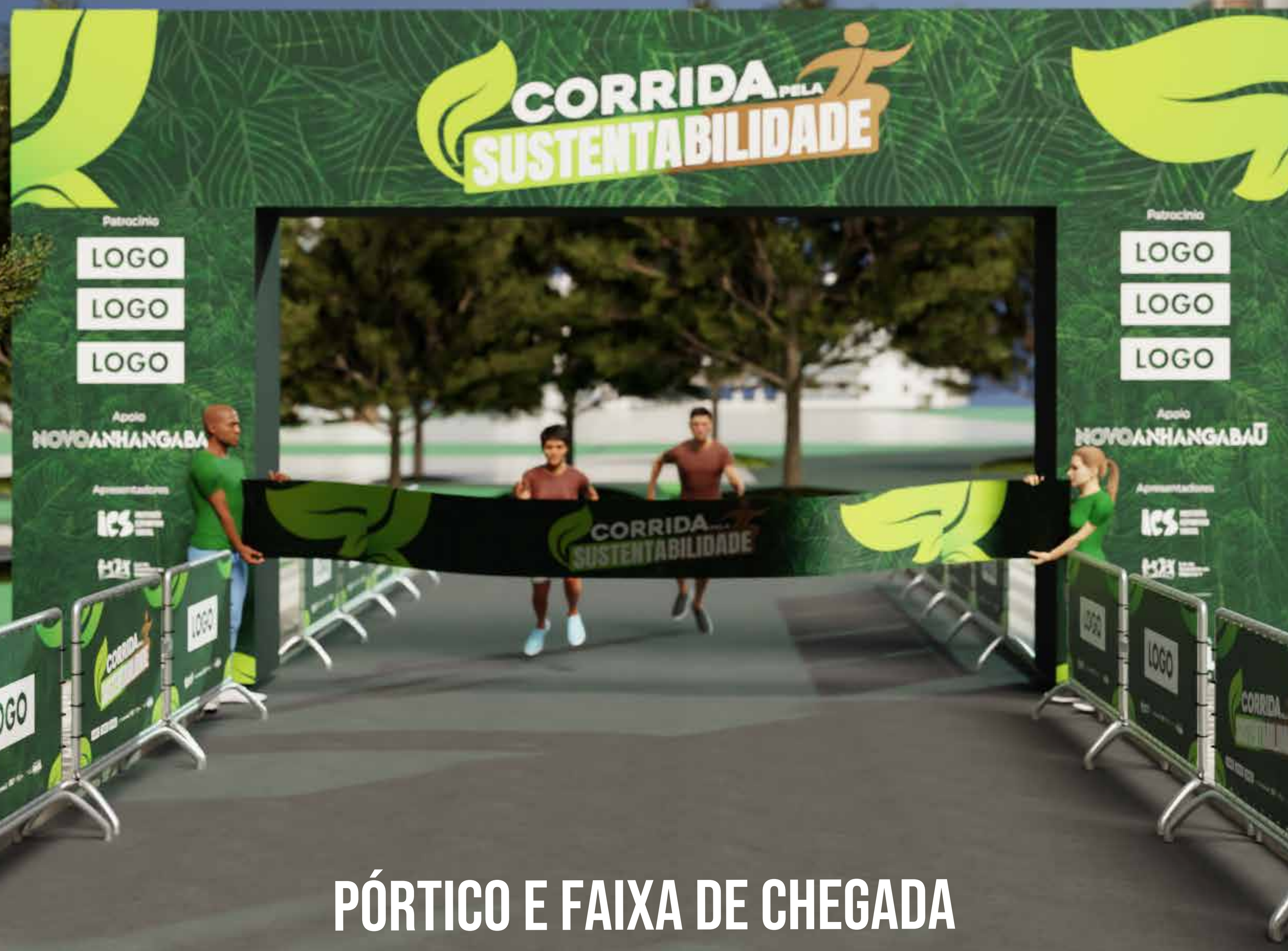
PÓRTICO E FAIXA DE CHEGADA