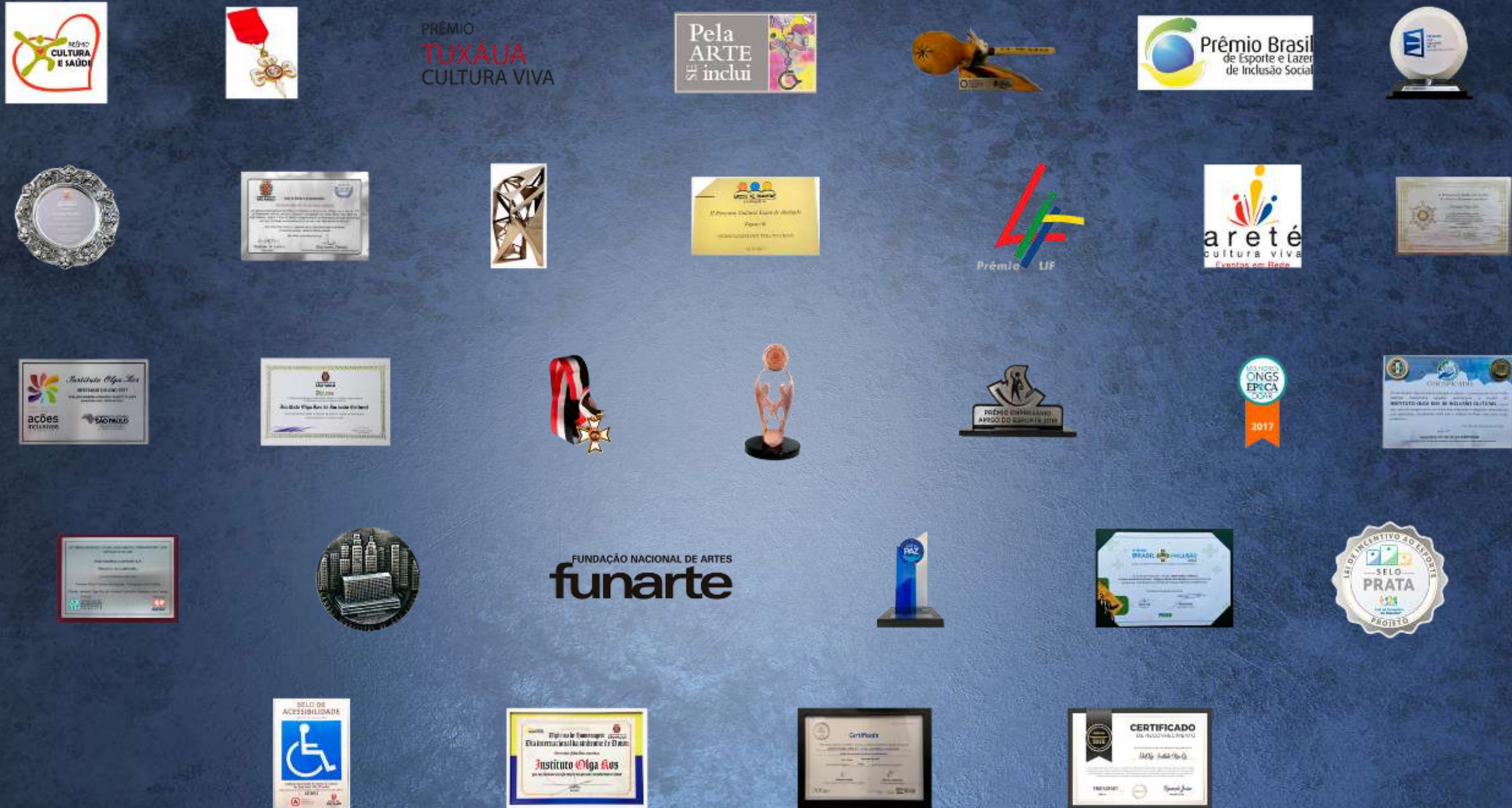
Prêmio Cultura e Saúde – Ordem do Mérito Cultural – Prêmio Tuxáua Cultura Viva 2010 – Prêmio Brasil Esporte e Lazer de Inclusão Social – Pela Arte se Inclui – Prêmio LIF 2013 – Prêmio Areté – Salva de Prata – Voto de Júbilo – Medalha Anchieta – Prêmio ABCA 2015 – II Encontro Cultural – Laços de Amizade Espaço K – Prêmio Chico Xavier – Prêmio Selo de Qualidade – Prêmio Melhores ONGs ÉPOCA Doar – Prêmio Destaque do Ano 2017 – Prêmio Movimento Voê e a Paz – Colar de Honra ao Mérito Legislativo – Prêmio Empresário Amigo do Esporte – Prêmio Brasil Mais Inclusão 2018/2019/2022 – Prêmio Brasileiro de Excelência Gráfica IPSIS – Selo Municipal de Direitos Humanos e Diversidade 2020/2021/2022 – Prêmio Funarte Respirarte – Prêmio Empreendedores e Inovadores – 2020 – Selo de Acessibilidade Arquitetônica – Diploma de Homenagem ao Dia Internacional da Síndrome de Down – Selo da Lei de Incentivo ao Esporte – Programa Selo Igualdade Racial – Ordem do Mérito Princesa Isabel – O Selo LIE (Lei de Incentivo ao Esporte)